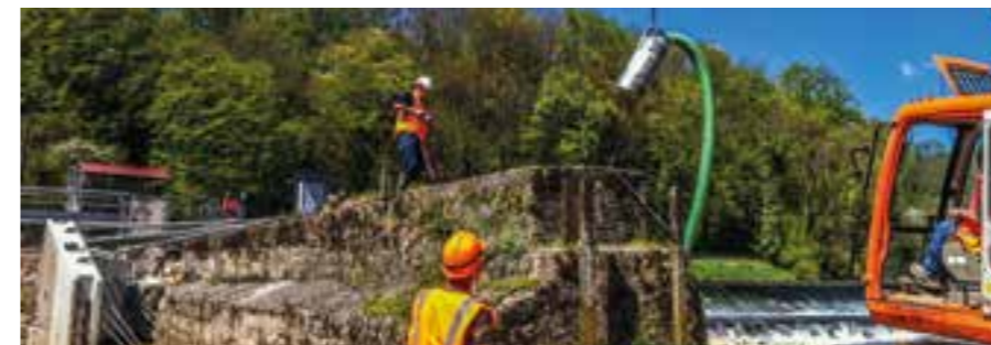
POMPES DE CHANTIER IMMERGÉES