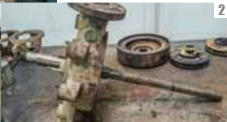
PHASES DE REMONTAGE D'UNE POMPE MULTICELLULAIRE WKL