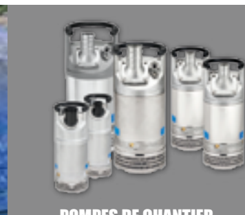
POMPES DE CHANTIER ALU, INOX, FONTE