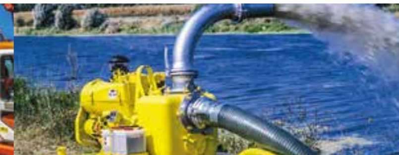
POMPES THERMIQUES SUR CHARIOT