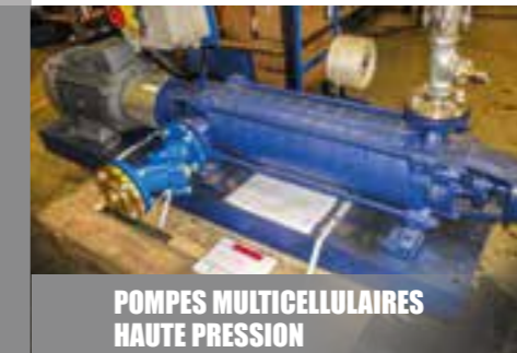
POMPES MULTICELLULAIRES HAUTE PRESSION