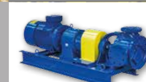
POMPES DE LIQUIDES VISQUEUX