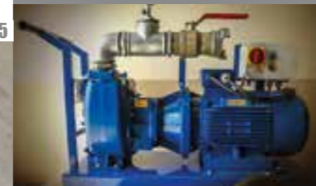
POMPES AUTO AMORÇANTES ÉLECTRIQUES