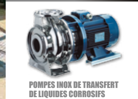
POMPES INOX DE TRANSFERT DE LIQUIDES CORROSIFS