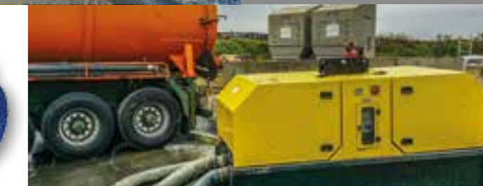
POMPES THERMIQUES INSONORISÉES