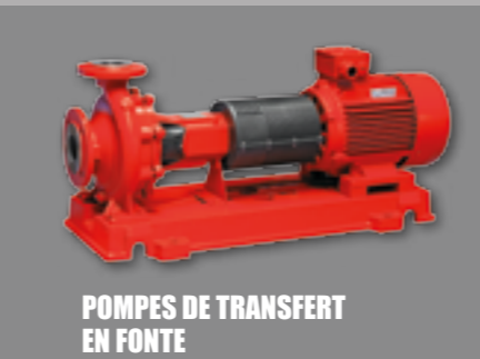
POMPES DE TRANSFERT EN FONTE