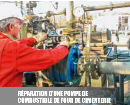
RÉPARATION D'UNE POMPE DE COMBUSTIBLE DE FOUR DE CIMENTERIE

La société Tech Pompes procède à la réparation de vos pompes, agitateurs et moteurs sur votre site de production ou dans nos ateliers. Nos expertises sont présentées dans un rapport détaillé et étayé de photographies vous permettant de comprendre précisément les dégâts relevés et leur ampleur, afin que vous puissiez adopter, si nécessaire, des actions correctives ciblées. Nous sommes en mesure de procéder à l'installation sur site des matériels que nous fournissons ou louons.